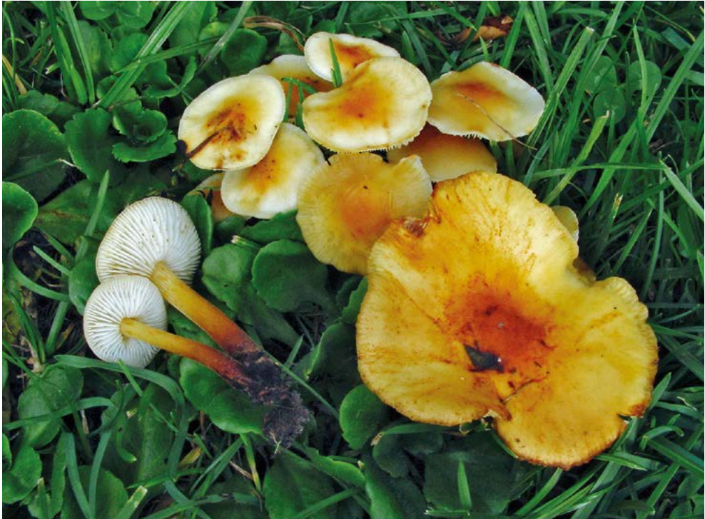
Abb. 7: Flammulina fenae 06.10.07 Alt-Gilching.