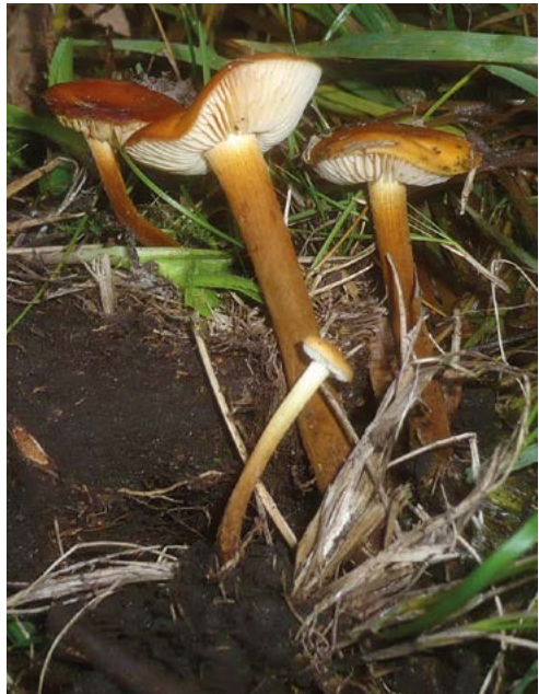
Abb. 4: Flammulina ononidis. Österreich, Würtenlacke, Apetlon, Bezirk Neusiedl am See, Burgenland, 28.11.2012